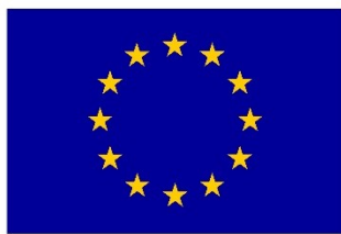
Euroopa Liit Euroopa Sotsiaalfond